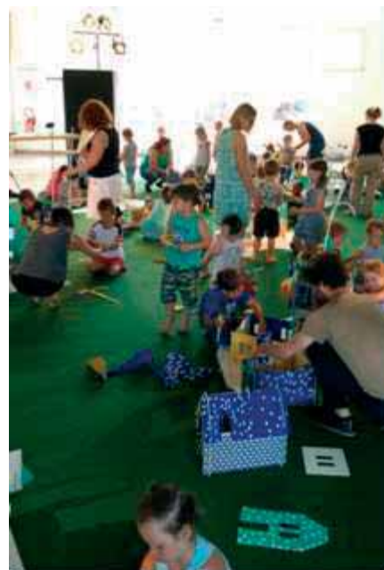
L'école maternelle de Beinheim à l'exposition interactive des Trames Ordinaires

Ils vous donnent rendez-vous en 2019 lors des ateliers musique et théâtre ouverts à tous, les jeudis 24 janvier, 7 mars, 4 avril – aussi le vendredi 5 avril - et le jeudi 23 mai en alternance au bureau des Sentiers à Beinheim et à la Saline à Soultz-sous-Forêts (informations sur www.surlessentiersduthetheatre.com ).