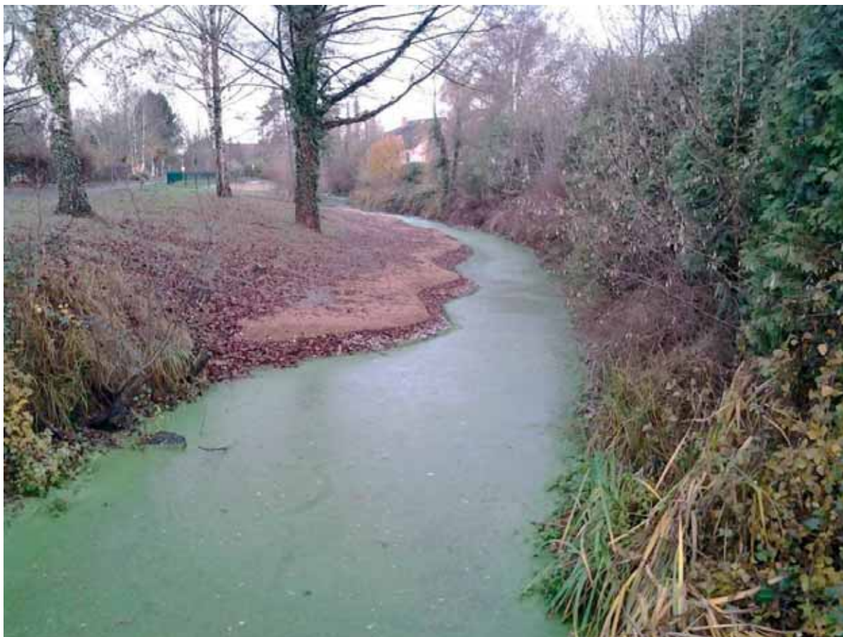
Le Stadenrhein en amont du pont, rue du Foyer

La Commune de Beinheim travaille depuis de nombreuses années pour le maintien de la biodiversité sur son territoire. Les écosystèmes contribuent à la qualité de vie dans la commune, ils sont vitaux et utiles pour l'homme, les autres espèces et les activités économiques. C'est pourquoi la Commune a engagé en 2014 une réflexion pour améliorer la qualité du Stadenrhein.