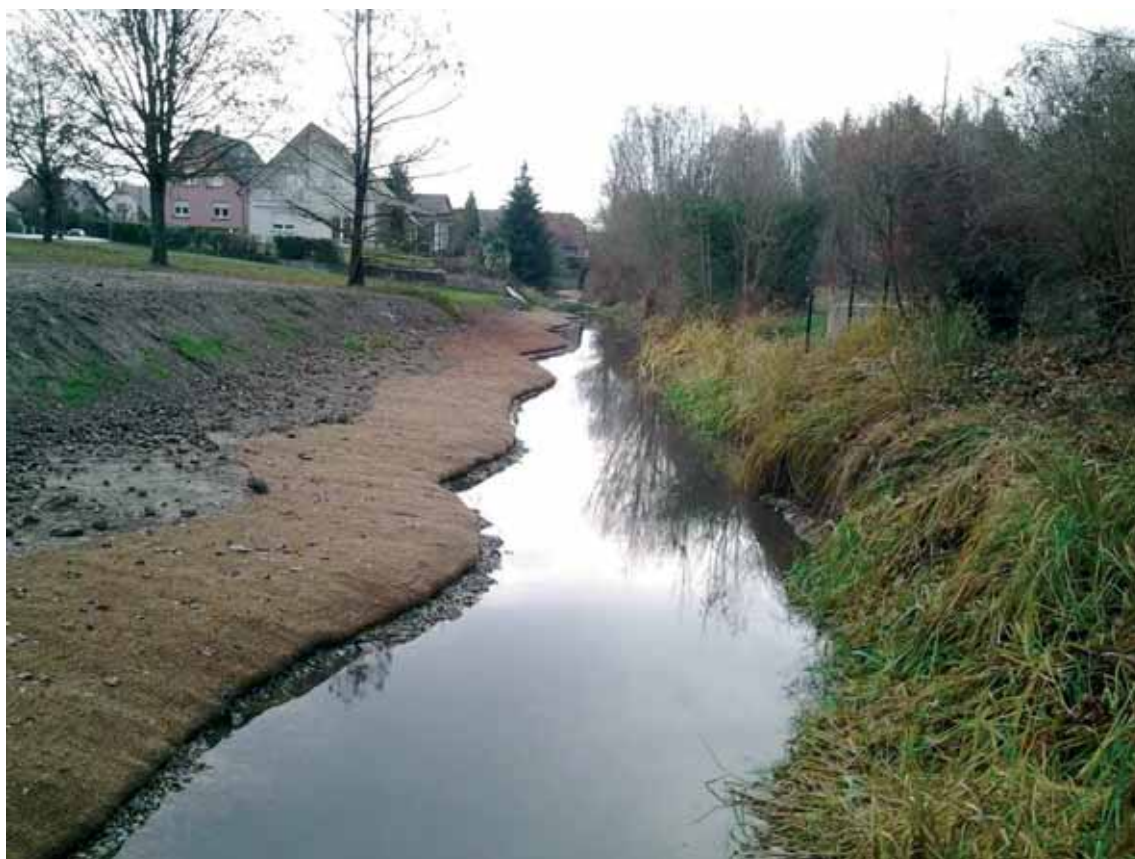
Le Stadenrhein en aval du pont, rue du Foyer

Les zones de rejet et de filtration végétalisées occupent une surface de traitement de 2 300m 2 . Le filtre sur le déversoir d'orage le plus en aval du Stadenrhein est complété par une zone de prairie humide et de marais de 900m 2 plantée de différentes espèces végétales aquatiques qui optimisent le tout. Cette zone complémentaire permet une épuration des eaux par les plantes (notamment sur les matières en suspension, les nitrates et le phosphore), crée un ouvrage naturel structurant le corridor écologique et offre une colonisation rapide du milieu par des espèces animales et végétales.