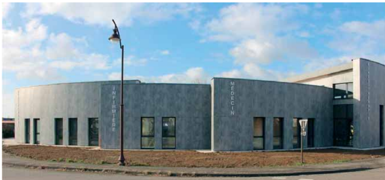
Le nouvel espace santé situé au rond-point de la Route du Rhin.

Le grand chantier 2018 fut l' espace santé qui a vu le jour au rond-point de la Route du Rhin. Malgré une météo parfois capricieuse, les travaux ont bien avancé et les premiers modules (kinésithérapeutes, médecin et infirmière) seront finis pour le début de la nouvelle année. Le cabinet vétérinaire prendra quelques semaines de plus.