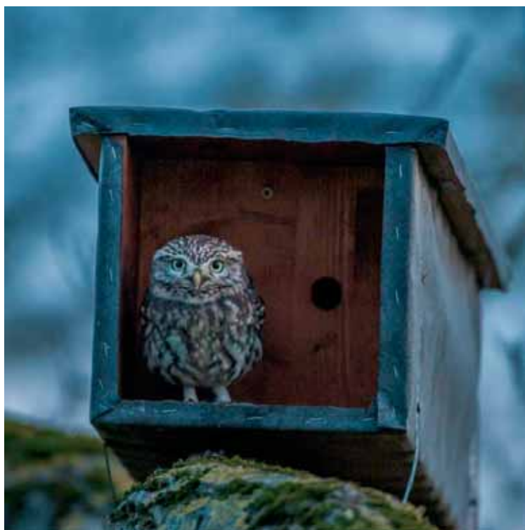
Chevêche à l'entrée du nichoir.

Une ancienne grange a fait l'objet d'une réhabilitation afin d'y loger la petite faune qui fréquente ce type de bâtiments : chouettes, fouine, hérisson, lérot, etc.