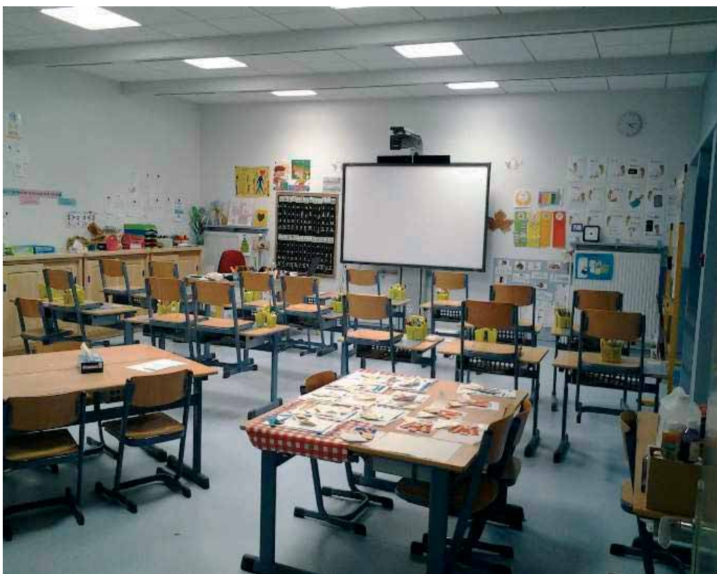
La classe du CP rénovée

En extérieur, la rénovation de la chapelle Saint Vit a fini avec les travaux de mise en lumière mais les sportifs profitent aussi de nouveaux aménagements : le terrain d'honneur du foot a totalement changé d'aspect avec sa nouvelle clôture, ses filets pare-balls et les abris de touche, tandis que sur les terrains de pétanque maintenant éclairés, il n'est plus question de ne pas voir le cochonnet. Et au Club Canin , une nouvelle clôture empêche Mirza et Médor de se sauver ! Les aménagements du Stadenrhein (Quellwasser) arrivent aussi peu à peu à leur achèvement, la mise en place de banquettes donne un bel aspect à la rivière qui a retrouvé du courant et des eaux toutes claires. Au cimetière ont été installés 17 nouveaux caveaux cinéraires.