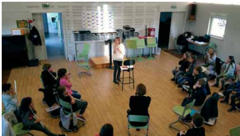
Atelier musique et théâtre avec les CM1 de l'orchestre à l'école de Beinheim avec l'ensemble Virévolte