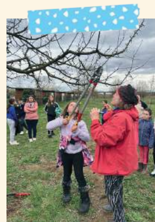
Taille au verger (CE2/CM1 et CM1/CM2)