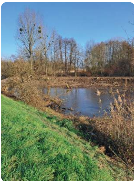
Frayère route de Seltz

Comme pour les mares, on peut aider la nature à reprendre ses droits et à coloniser la frayère mais le plus gros du travail, c'est la nature elle-même qui s'en charge. Le vent, les crues, les oiseaux et autres animaux transportent tout ce qui est nécessaire et en quelques saisons, la frayère retrouve un aspect sauvage et offre ses bons offices avec générosité.