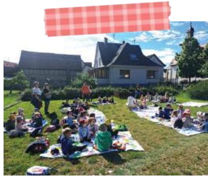
Projet pique-nique avec les petits de la crèche