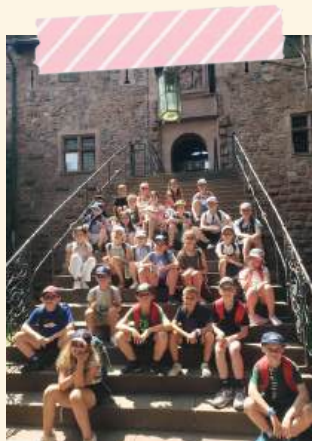
Sortie de fin d'année au Haut-Koenigsbourg et à la Volerie des aigles (du CP au CM2)