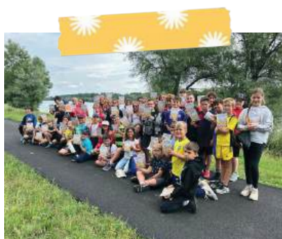
Balade à énigmes « Rhin vivant » (CE2/CM1 et CM1/CM2)