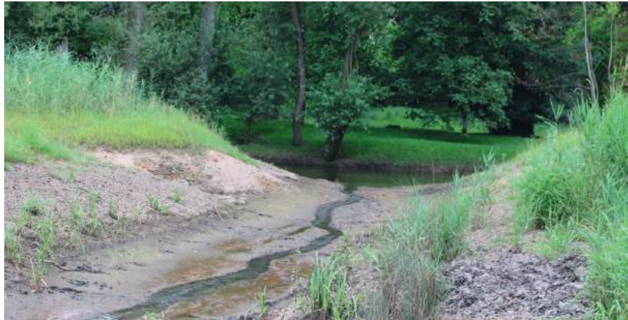
Frayère du Niederwald