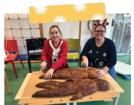
Goûter de la Saint Nicolas