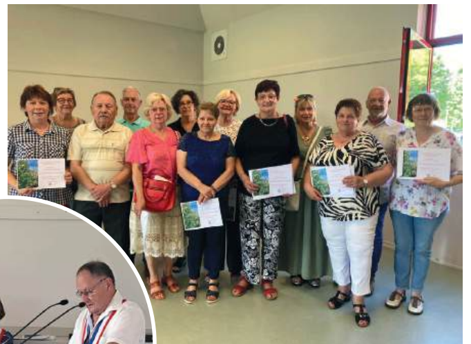
Lauréats concours fleurissement