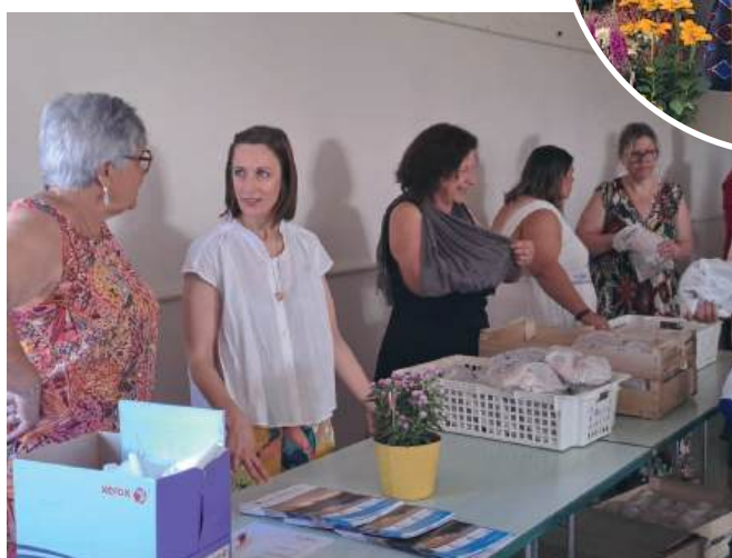
Distribution des petits pains