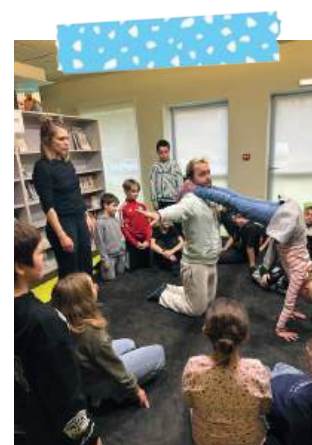
Atelier artistique avec le spectacle DORI (du CP au CM2)