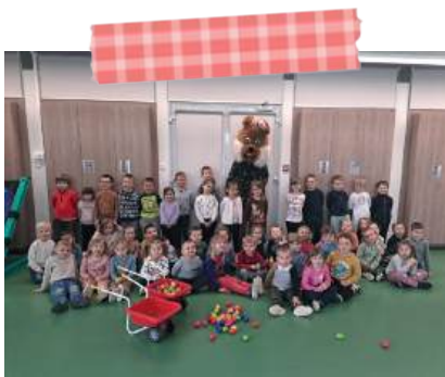
La venue du lapin de Pâques