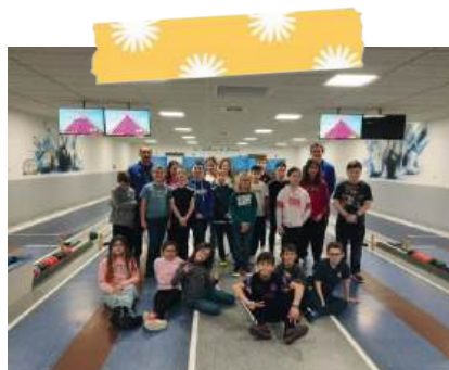
Cycle quilles (du CP au CM2) avec le club des quilleurs