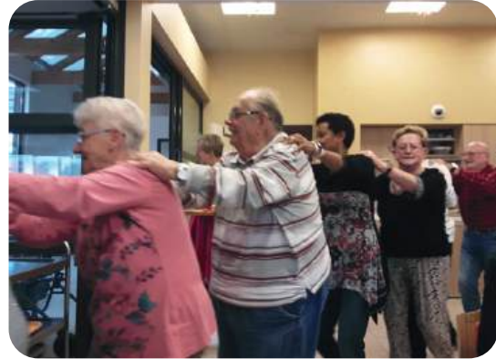
Fête de la Bière