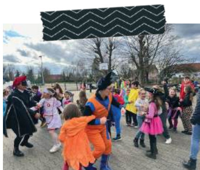
Carnaval (du CP au CM2)