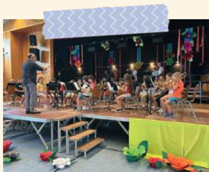
Répétition du concert pour la fête scolaire (du CE1 au CM2)