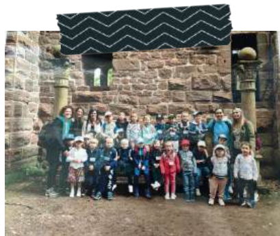
La sortie de fin d'année au château du Haut-Koenigsbourg