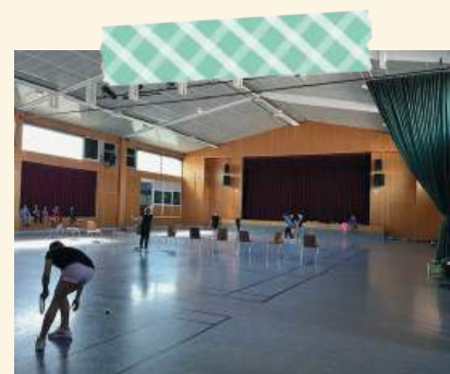
Cycle de tennis avec le club de tennis de Seltz (du CP au CM2)