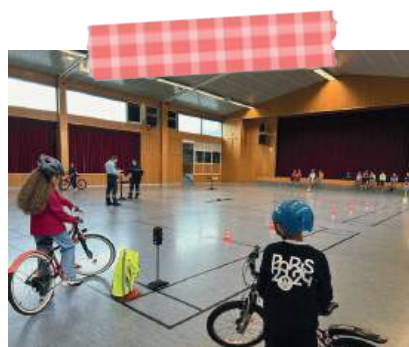
Éducation à la route (CM1/ CM2) avec la gendarmerie de Wissembourg