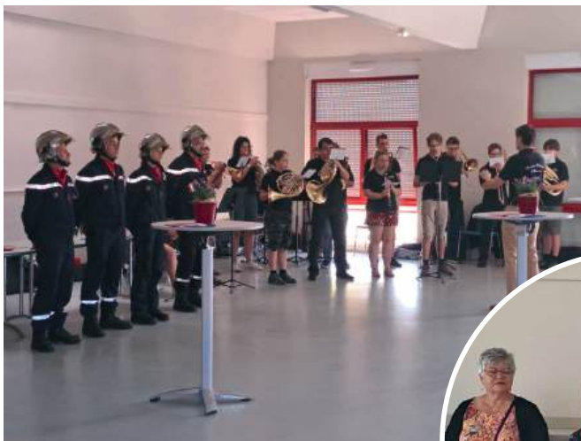
OHB et sapeurs-pompiers

L'ambiance festive fut assurée par l'OHB (Orchestre d'Harmonie de Beinheim) et la Marseillaise saluée par les sapeurs-pompiers. Après la distribution du cadeau aux jeunes de 14 ans, petits et grands ont enfin savouré les traditionnels petits pains briochés autour du verre de l'amitié qui a clos cette belle cérémonie !