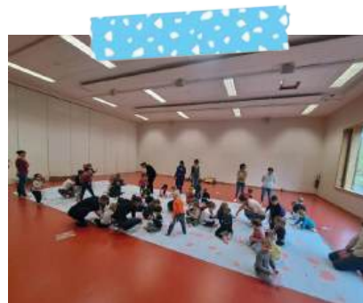
L'anniversaire des Sentiers du théâtre