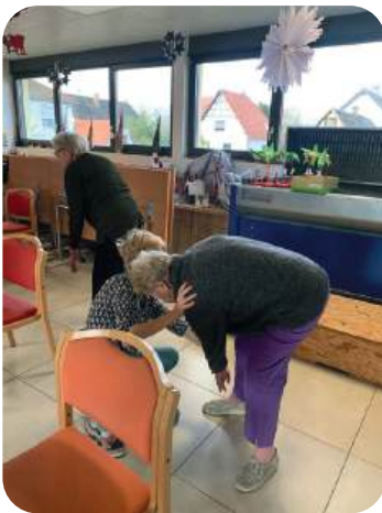
Atelier Gym douce